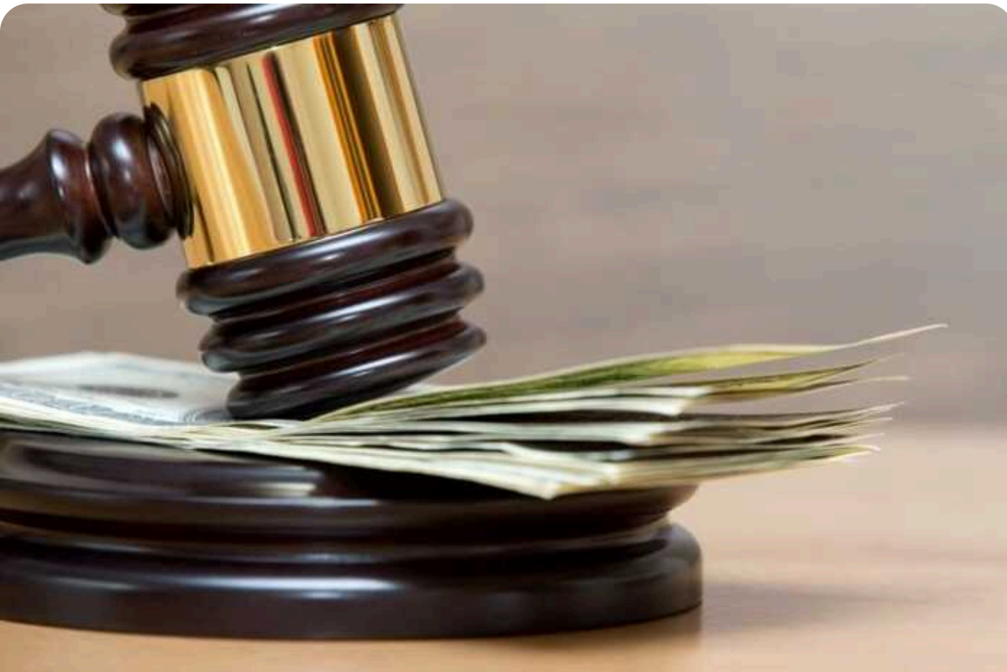
Фейкові інвойси та пільги з ЄС: на Волині оштрафували директора фірми за махінації з імпортом побутової хімії