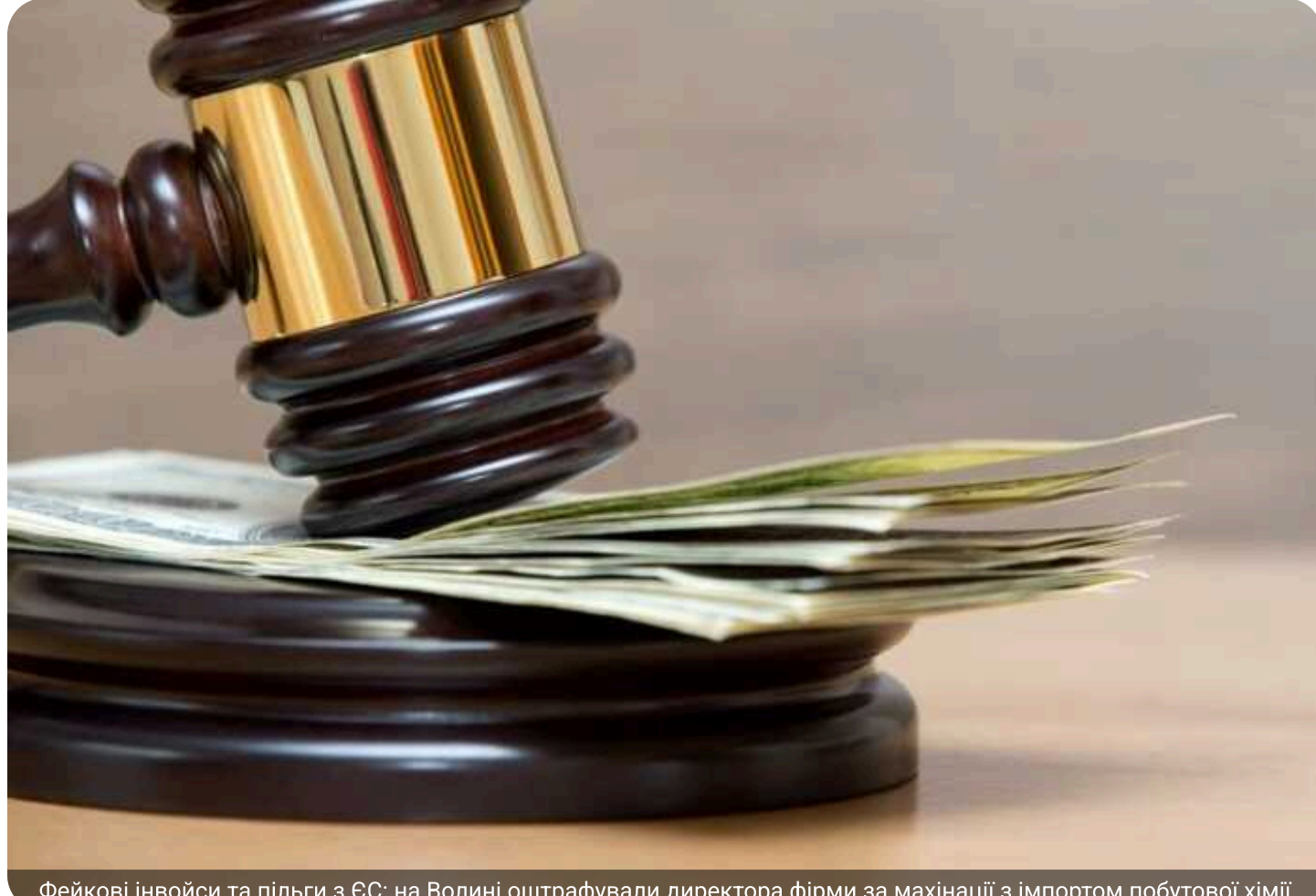
Фейкові інвойси та пільги з ЄС: на Волині оштрафували директора фірми за махінації з імпортом побутової хімії