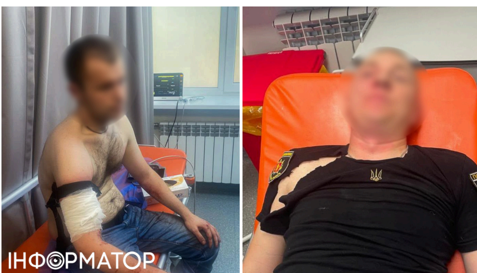
Напад на поліцейських під час обшуку у Запоріжжі, колаж: Інформатор

У Запоріжжі фігурант кримінального провадження напав із ножем і сльозогінним газом на поліцейських, які проводили санкціонований обшук у його домівці. Подібний напад на поліцейських на Вінниччині також стався під час перевірки - тоді двоє зловмисників розстріляли патруль і втекли. Цього ж дня, 11 червня, близько 15:40 у Заводському районі міста ситуація вийшла з-під контролю вже в ході слідчих дій. Троєх поранених правоохоронців госпіталізовано, нападник загинув від пострілу табельної зброї.