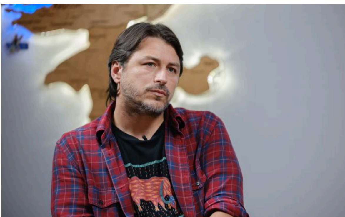
Фото: Сергій Притула (Віталій Носач, РБК-Україна)