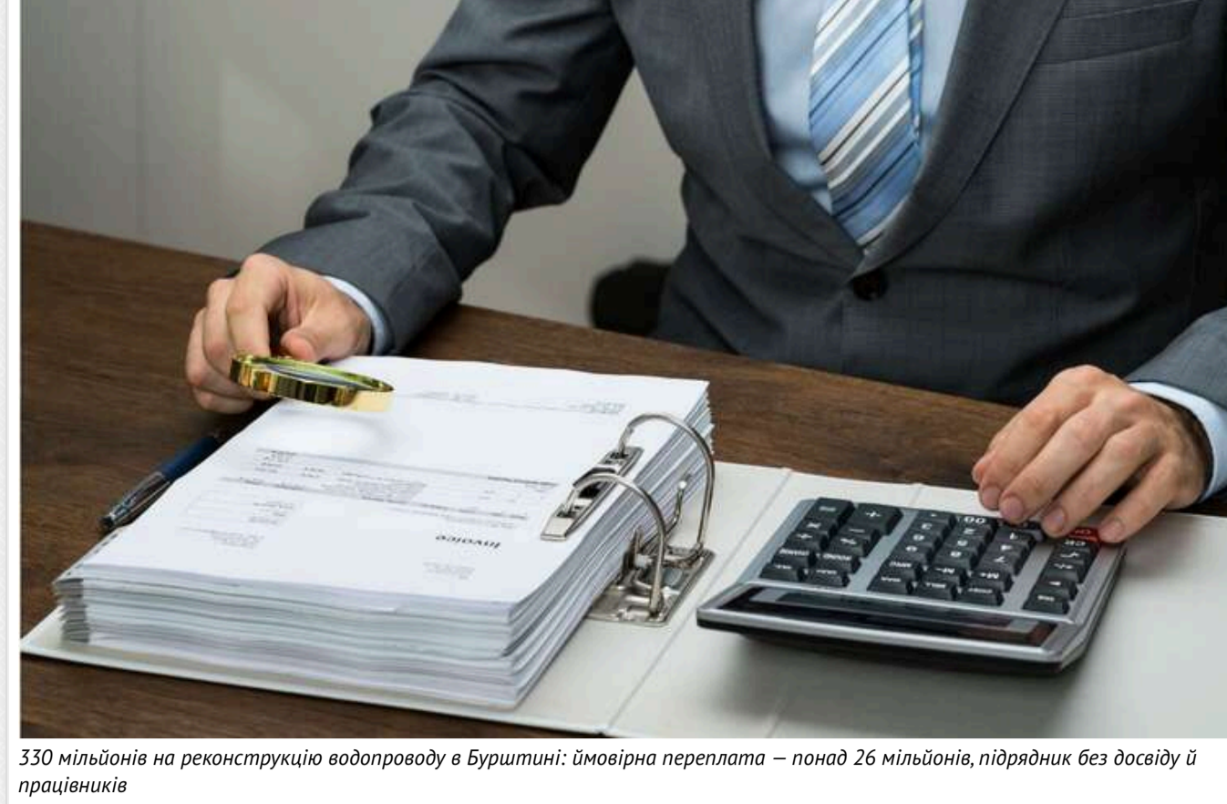
330 мільйонів на реконструкцію водопроводу в Бурштині: ймовірна переплата – понад 26 мільйонів, підрядник без досвіду й працівників

Чекати на розкоші | Додати на основі Джерело в Google