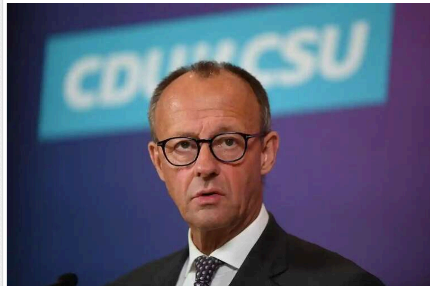
Мерц намагається примирити Мелоні й Макрона, - FT

Канцлер Німеччини Фрідріх Мерц намагається врегулювати дипломатичну суперечку між Римом і Парижем після того, як прем'єр-міністерка Італії Джорджа Мелоні не була долучена до останніх переговорів лідерів ЄС та США щодо розв'язання війни між РФ та Україною.