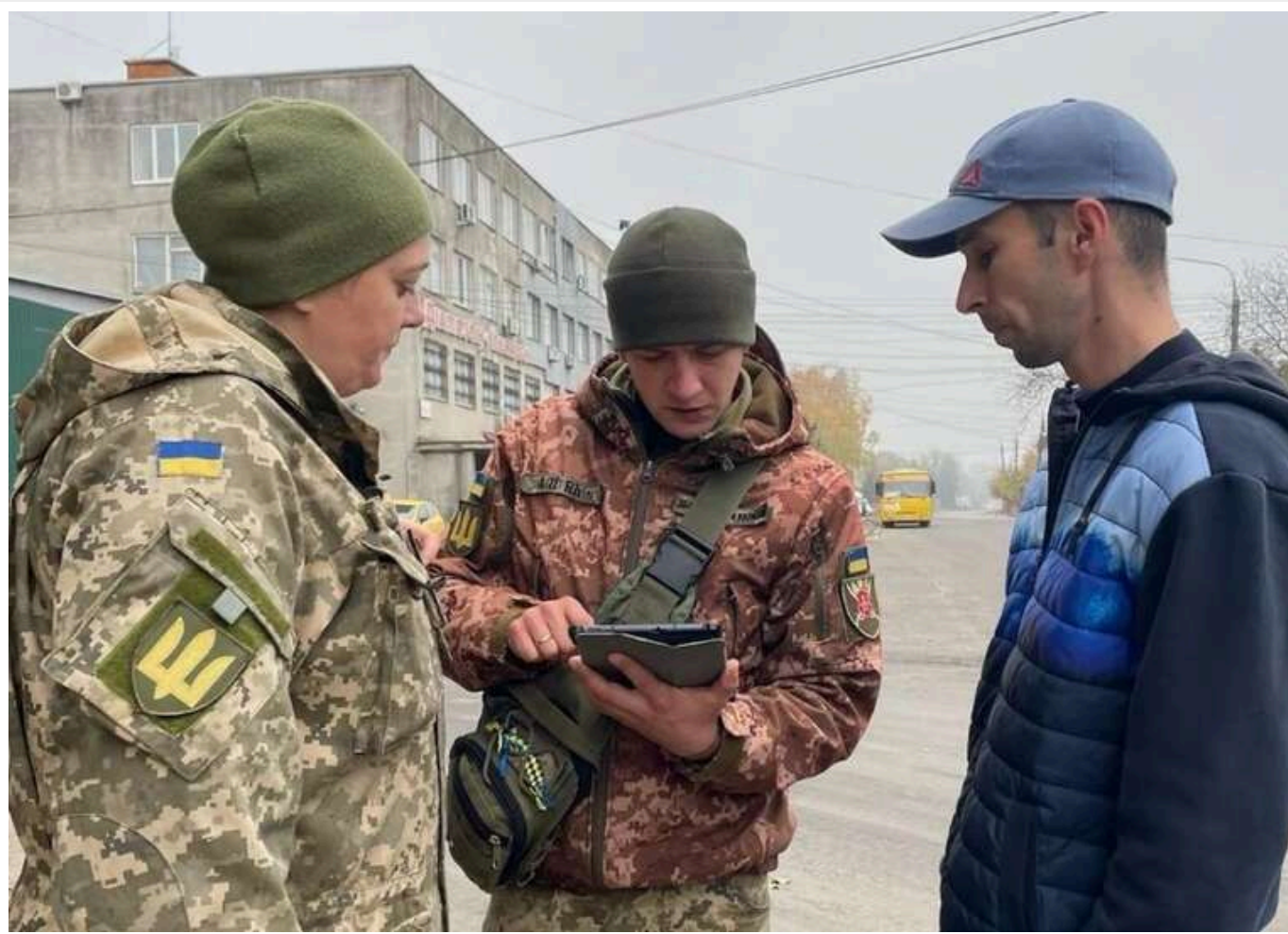
Співробітники ТЦК не мають носити піксель, потрібно розробили іншу форму, – нардеп

Читати на руском Read in English Додати як бажане джерело в Google