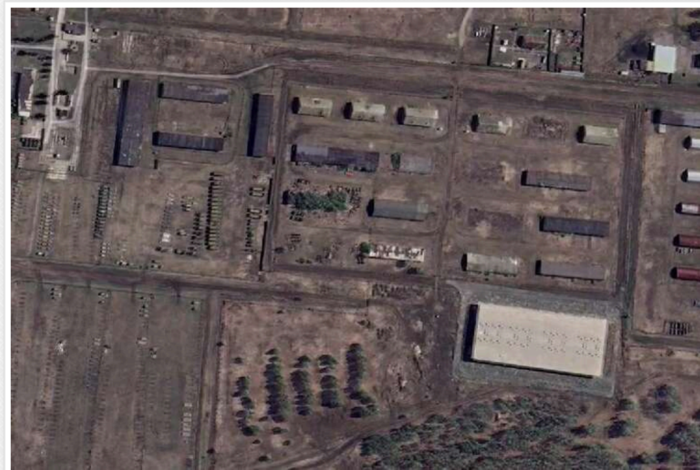
На базі Омського автобронетанкового інституту в Росії вичерпали запаси бронетехніки – супутникові знімки

Супутникові кадри показали значне скорочення запасів бронетехніки на базі зберігання Омського автобронетанкового інституту у Росії. У 2021 році на складі зберігалось близько 120 танків, 89 БТР, 41 БМП та 54 гармати МТ-12 «Рапіра».