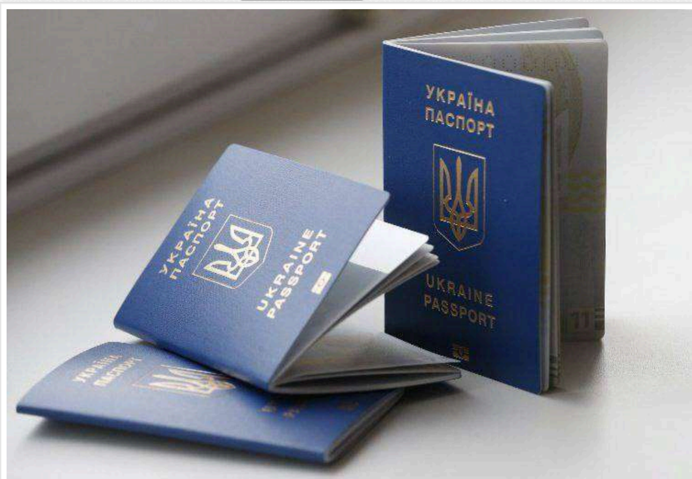
Українці, які оформлювали паспорти за кордоном, повинні забрати їх до 1 червня 2025, інакше їх відправлять в Україну, – ЗМІ

Читати на руськом Read in English Додати як бажане джерело в Google