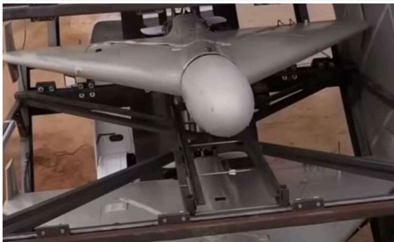
У Росії – дронабум: стартапи маскуються під цивільні проекти, але працюють на війну

У Росії стрімко зростає кількість компаній, які займаються виробництвом безпілотників, зокрема для військових цілей.