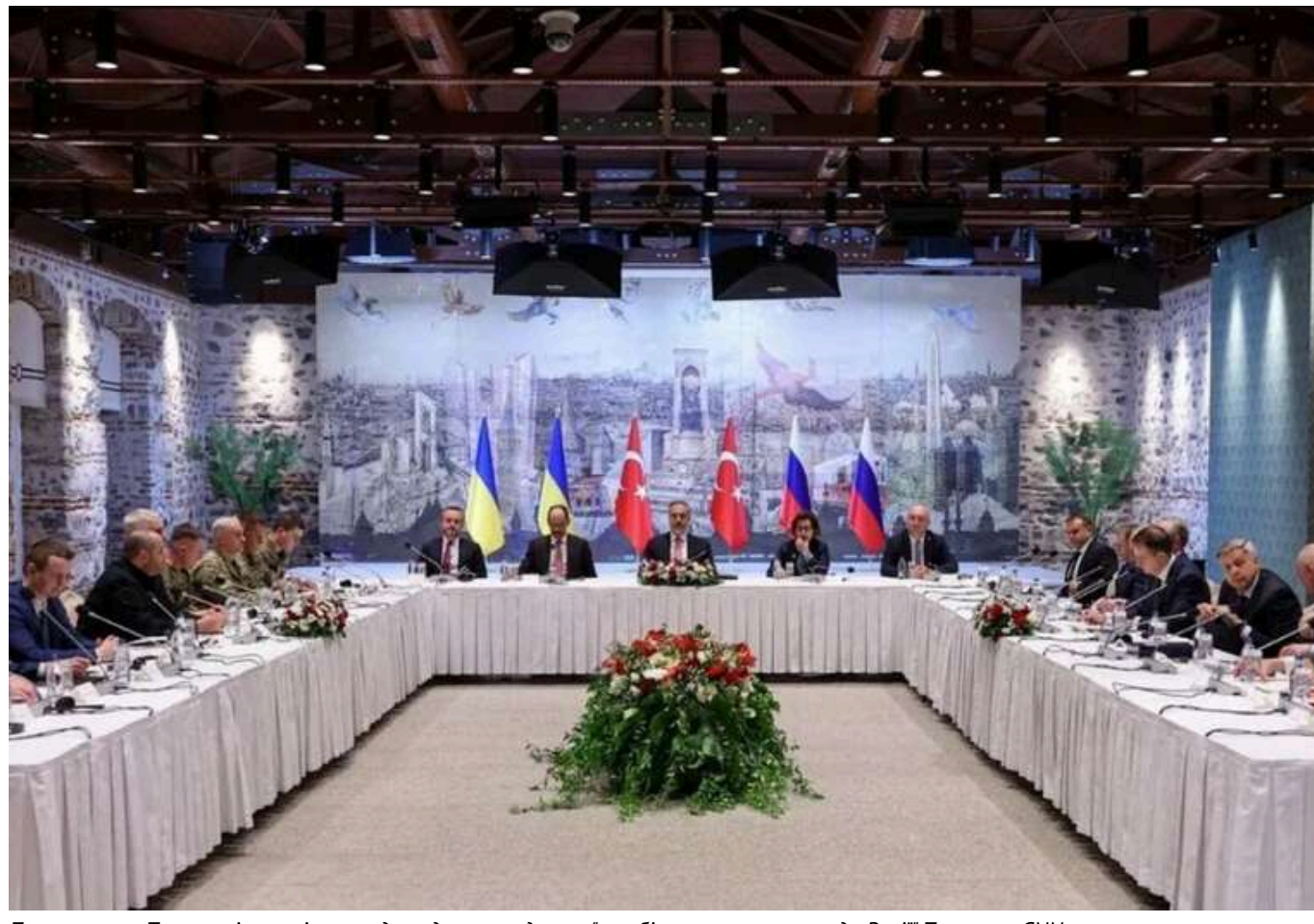
Переговори в Туреччині організували для одного глядача – "стабільно прихильного до Росії" Трампа, – CNN