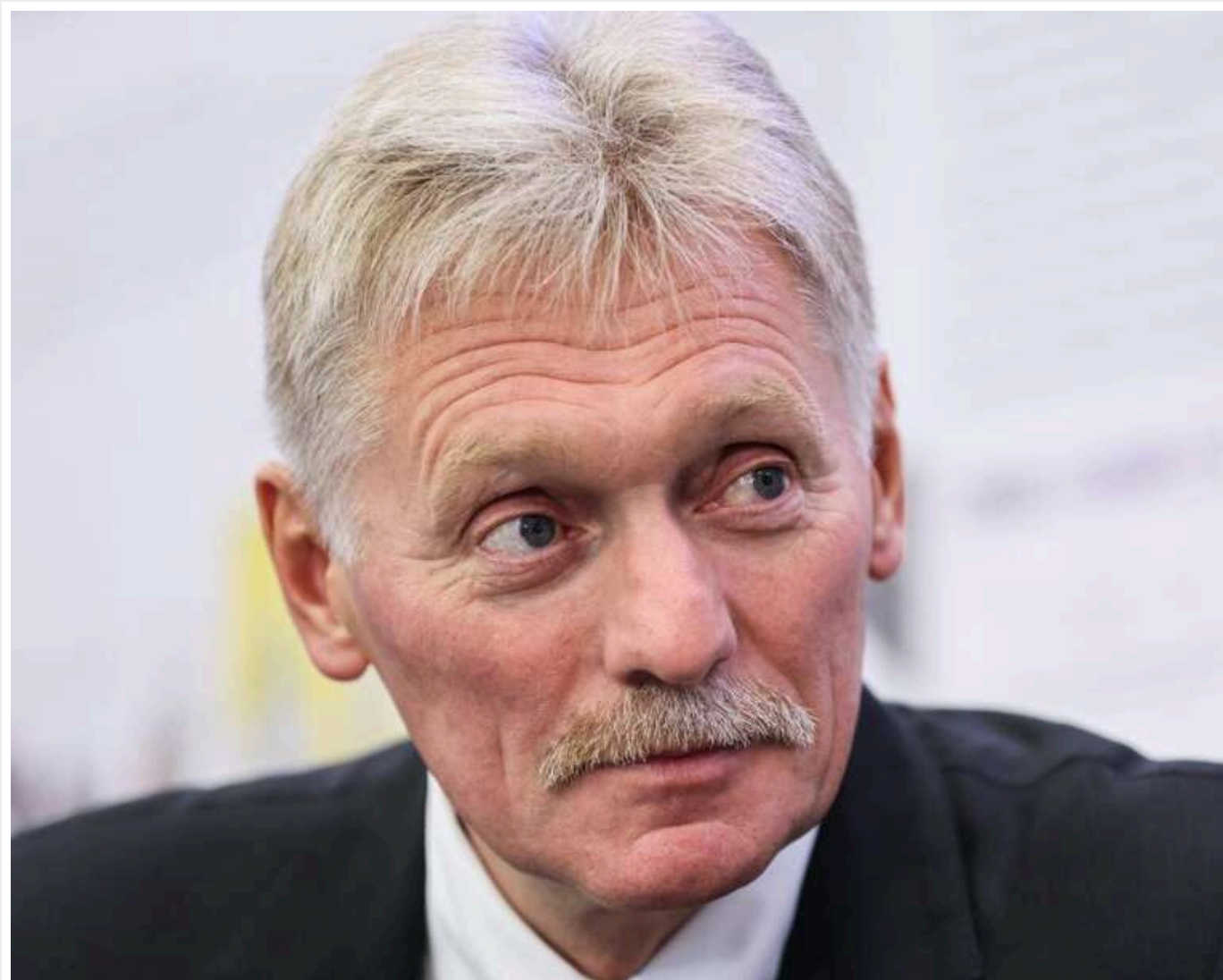
Зустріч Путіна й Зеленського можлива, — Песков

Читати на руськом Read in English Додати як багаторазове джерело в Google