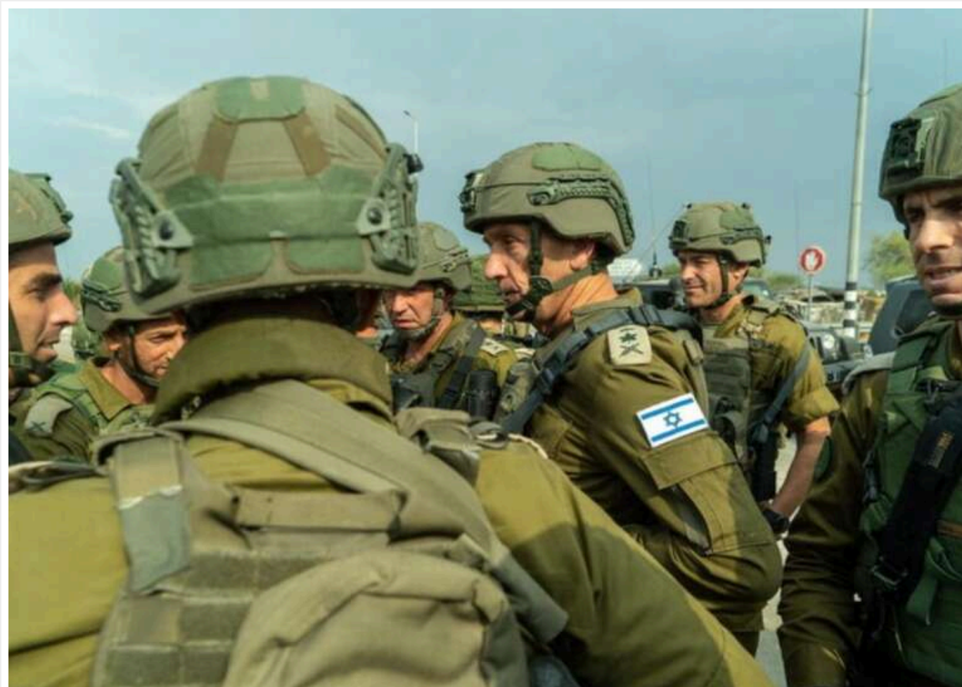
Ізраїль ініціював нову великомасштабну операцію в Газі

Читати на руськом Додати як сховане джерело в Google