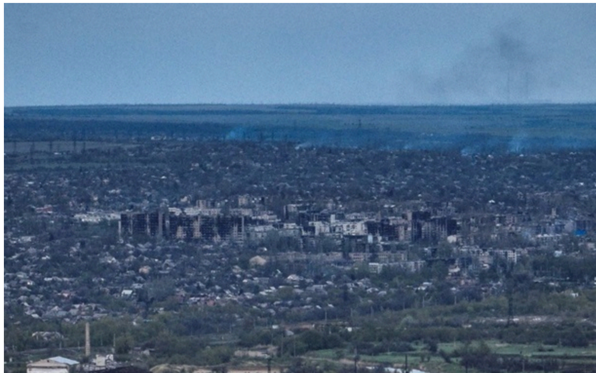
Атака фосфорними бомбами на Костянтинівку 7 червня

У Костянтинівці вже йдуть запеклі вуличні бої, росіяни змогли просочитися до міста з трьох боків.