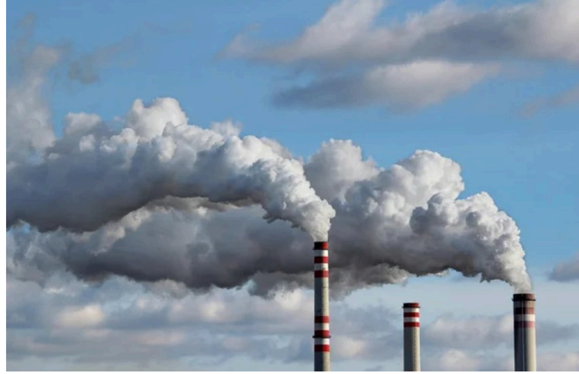
Кабмін запустив механізм міжнародної торгівлі викадами парникових газів

Кабінет Міністрів України ухвалив постанову, яка створює правову та інституційну основу для запуску механізму міжнародної торгівлі скороченнями викидів парникових газів. Це рішення відповідає статті 6 Паризької угоди та відкриває для країни вихід на світові вуглецеві ринки.