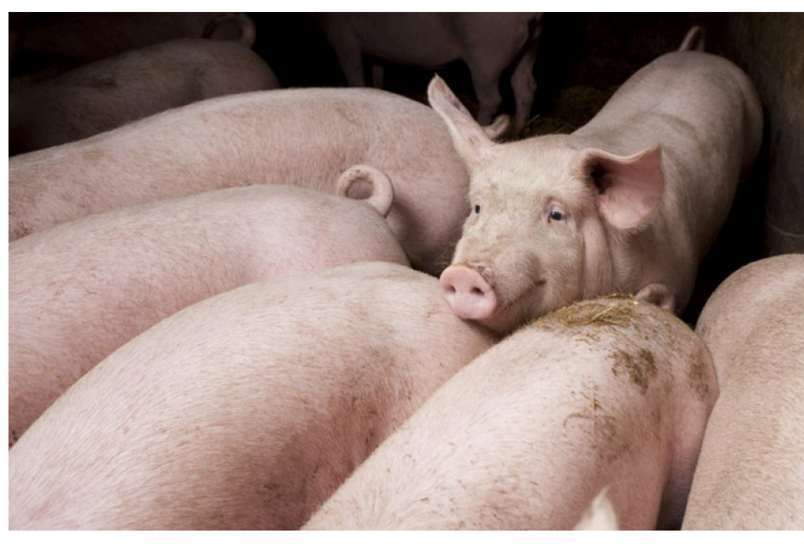
Які ціни на свиней живою вагою в Україні

Delo.ua повідомляє, які закупівельні ціни на свиней живою вагою очікуються в період 15-21 червня 2026 року. Прогноз надали фахівці Асоціації "М'ясної галузі".