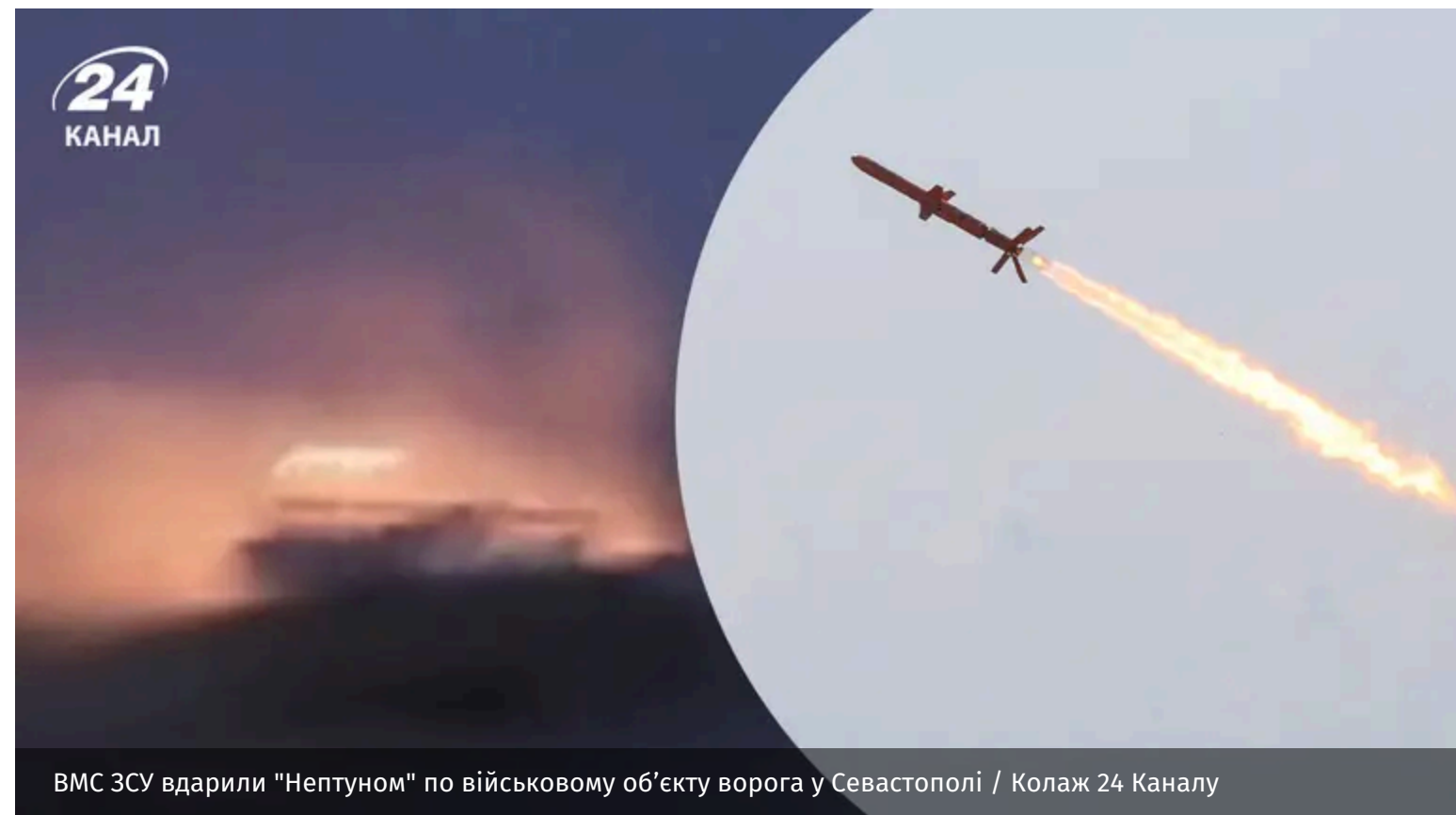
ВМС ЗСУ вдарили "Нептуном" по військовому об'єкту ворога у Севастополі

У ніч на 11 червня 2026 українські військові завдали удару ракетою "Нептун" по військовому об'єкту противника. Ціль була розташована в бухті Стрілецька міста Севастополь в окупованому Криму.