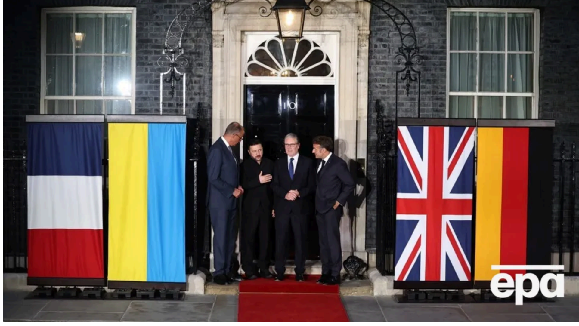
Мерц, Стармер і Макрон висунули умови для досягнення миру в Україні після зустрічі із Зеленським

11 червня, 16:50 Этот материал также можно прочитать на русском