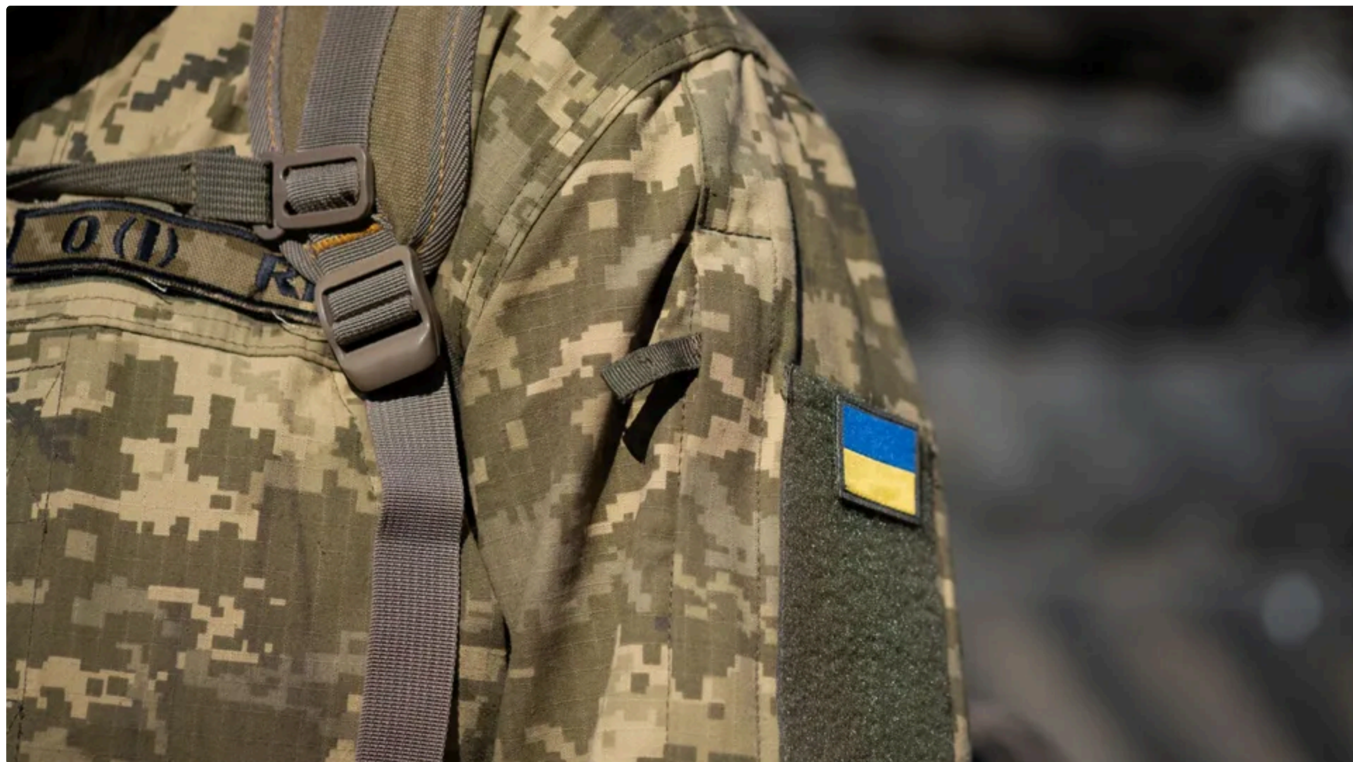
За даними Железняк, на армію бракує приблизно 150 млрд грн

11 червня представники фракцій Верховної Ради України обговорили на зустрічі з урядовцями фінансування підвищення грошового забезпечення військовослужбовцям і реформи оплати праці. Про це в Telegram повідомив народний депутат від партії "Голос" Ярослав Железняк.