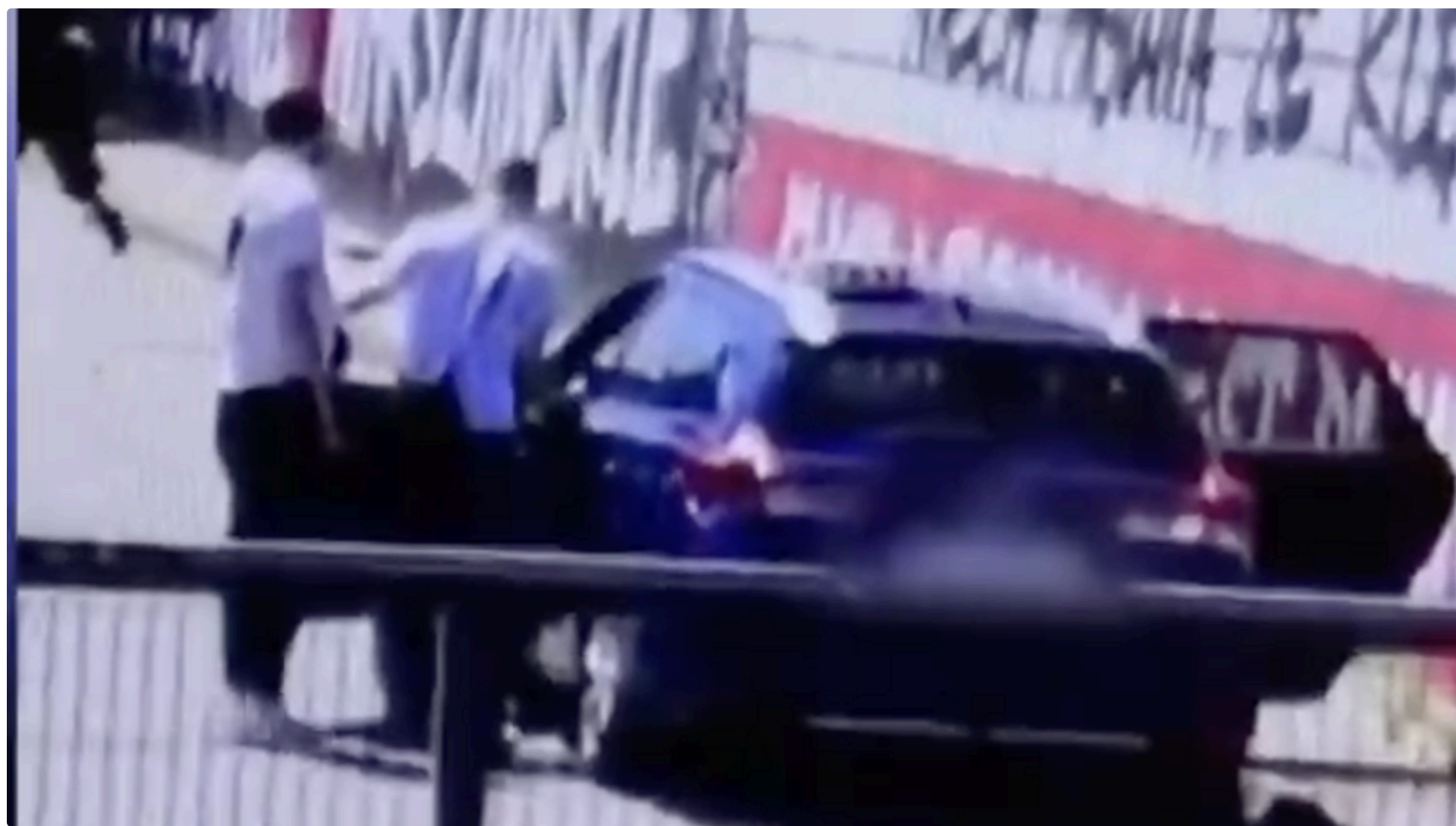
Усіх чотирьох підозрюваних заарештували

У Вроцлаві затримали чотирьох іноземців із Казахстану, України й Тунісу, яких підозрюють у викраденні, розбійному вимаганні й побитті двох 20-річних українських молодиків. Про це 11 червня повідомило міське управління поліції у Вроцлаві.