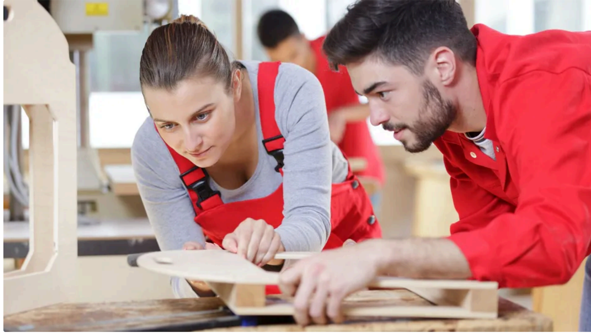
В опитуванні взяли участь 1015 респондентів з усіх регіонів України

11 червня, 17:02 🌐 Цей матеріал також можна прочитати на руськом