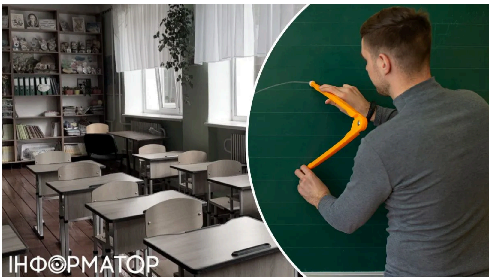
Вчитель-колаборант із Запорізької отримав 10 років.

Суд виніс вирок колишньому вчителю з окупованої частини Запорізької області - чоловіка засудили до 10 років позбавлення волі за колабораційну діяльність. Раніше трьох депутатів-колаборантів із Запорізької області також викрили за поширення пропаганди РФ та роботу в окупаційних структурах. Цей вирок став черговим прикладом того, як українська Феміда притягує до відповідальності тих, хто свідомо обрав бік окупантів. Справу розглянули в порядку спеціального судового розгляду.