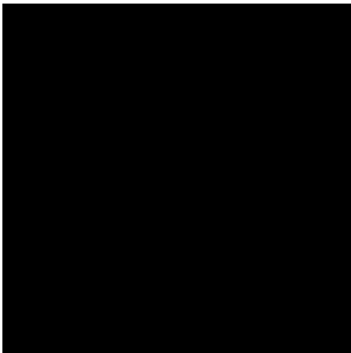
Курс валют НБУ на 12 червня (Інфографіка РБК-Україна)

Таким чином, після кількох днів зростання обидві валюти дещо скоригувалися вниз, хоча залишаються поблизу високих рівнів останніх тижнів.