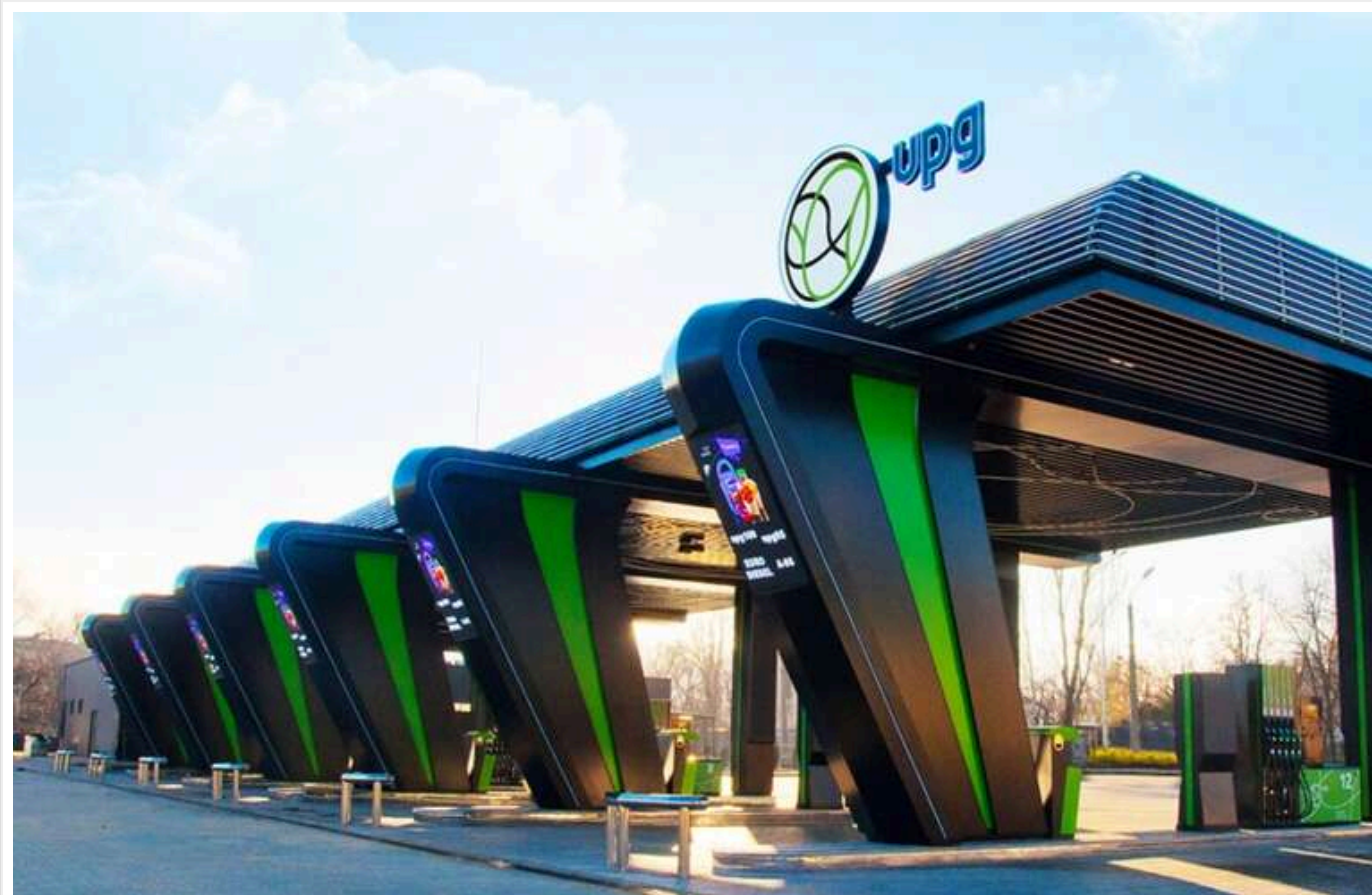
UPG готується орендувати 400 АЗС «Привату»: Антимонопольний комітет може вирішити долю ринку пального

Згідно з даними Антимонопольного комітету, мережа АЗС UPG спочатку планує орендувати 34 заправок Авіас, але в перспективі планує отримати 350-400 АЗС.