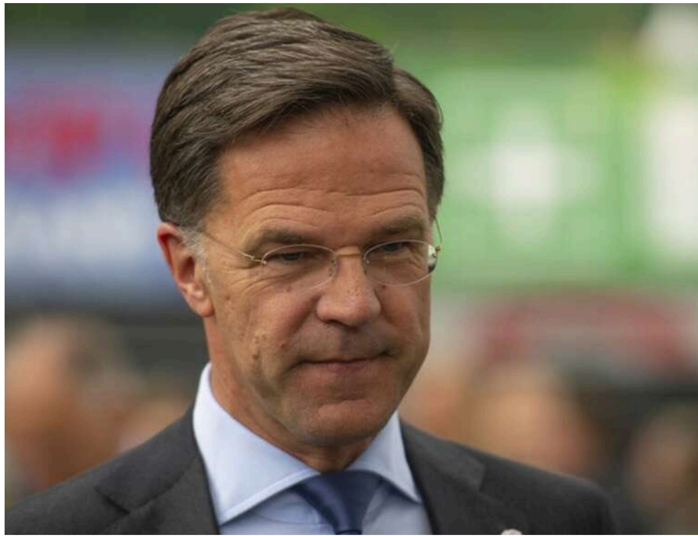
Він припустився «великої помилки», - Рютте про відмову Путіна приїхати на переговори

Путін припустився «великої помилки», відправивши сьогодні до Стамбула команду перемовників низького рангу.