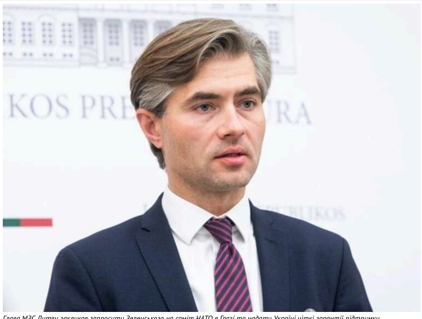
Глава МЗС Литви закликав запросити Зеленського на саміт НАТО в Гаазі та надати Україні чіткі гарантії підтримки

Міністр закордонних справ Литви Гітутіс Бударіс вважає, що президент Володимир Зеленський має бути запрошений на саміт НАТО в Гаазі у червні, де повинен почути чітке зобов'язання Альянсу підтримувати Збройні Сили України.