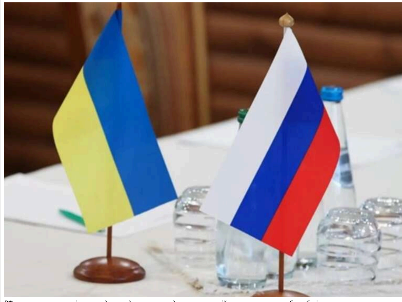
РФ заявляє про можливість погодження документа щодо завершення війни на переговорах у Стамбулі

Представник Міністерства закордонних справ Росії Родіон Мирошник заявив, що Україна та Росія "мають шанси" погодити документ про завершення війни під час майбутніх переговорів у Стамбулі.