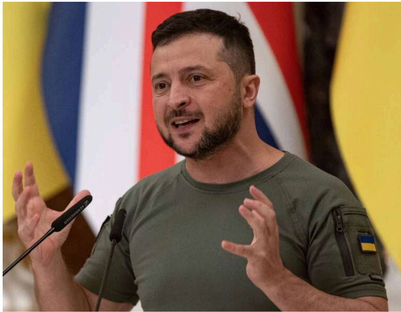
Зеленський: Україна визначить кроки щодо перемовин у Стамбулі після оголошення складу російської делегації

Україна визначить свої наступні кроки щодо переговорів у Стамбулі після того, як Російська Федерація оприлюднить склад своєї делегації.