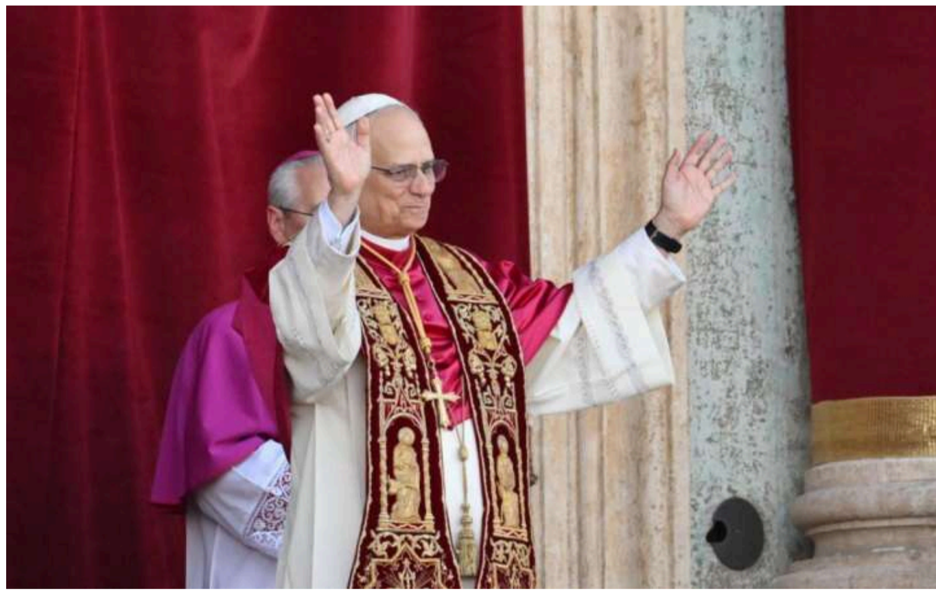
Папа Римський поки не ухвалив рішення щодо візиту до Києва, — держсекретар Ватикану

Читати на руськом Read in English Додати як бажане джерело в Google