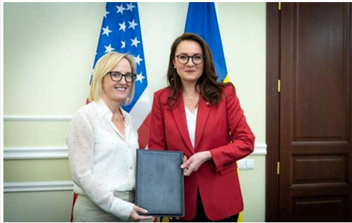
Угода про надра: Україна і США підписали ключові документи про створення та роботу Інвестиційного фонду відновлення

Читати на руськом Read in English Додати як бажане джерело в Google