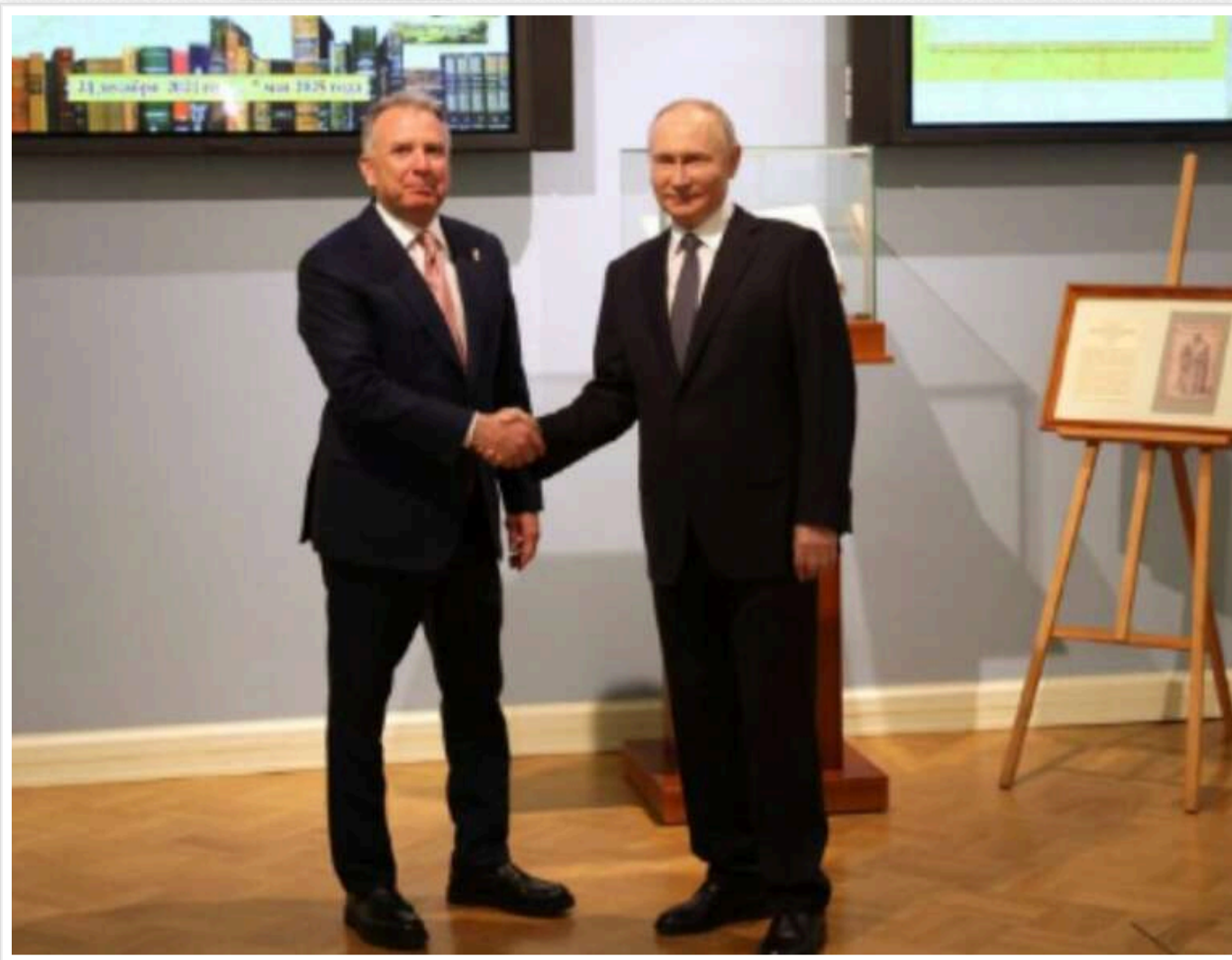
Віткофф відхилив критику з приводу своїх зустрічей із Путіним: «Потрібно спілкуватися з усіма»

Спеціальний посланець президента США Стів Віткофф відкинув критику на свою адресу після низки зустрічей із російським диктатором Володимиром Путіним, заявивши, що жодної угоди для завершення війни РФ проти України «не буде без підпису Путіна».