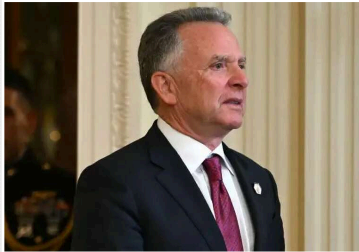
Укладення угоди без підпису Путіна не відбудеться, – Віткофф

Спецпредставник Дональда Трампа Стив Віткофф заявив, що жодна угода неможлива без погодження з очільником Кремля Володимиром Путіним. За його словами, США "повинні говорити з усіма".