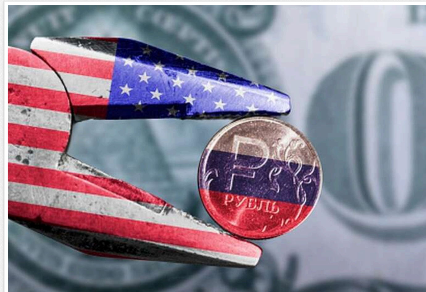
США поки не дали чіткої відповіді щодо санкцій проти РФ у разі провалу переговорів у Стамбулі, — Bloomberg

Вашингтон поки не відповів європейським партнерам, чи готові США запровадити нові санкції проти Росії, якщо Москва відмовиться від перемир'я, а переговори в Стамбулі завершаться безрезультатно.