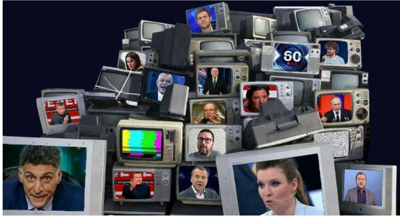
Загарбники вкрали українське обладнання з Херсонщини та запустили канал в окупованому Криму

У тимчасово окупованому Криму було відкрито студію пропагандистської телерадіокомпанії «Таврія». Вона функціонує на вкраденому у Суспільного обладнанні під час відступу з правобережжя області у 2022 році.