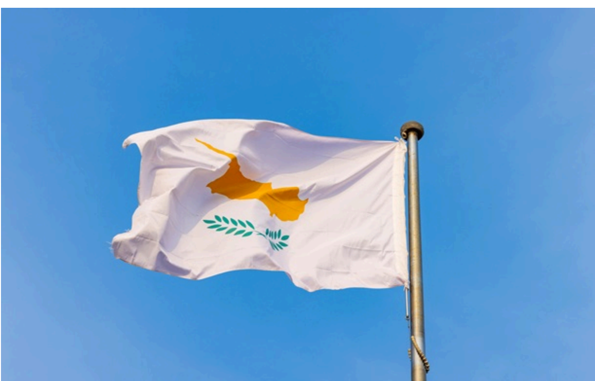
Росіяни залишаються без візових центрів Кіпру