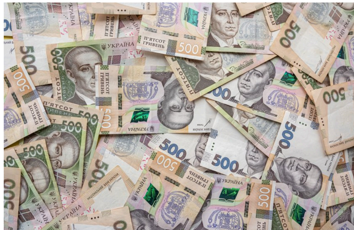
Фонд гарантування вкладів перерахував до держбюджету 5,3 мільярда гривень

За результатами діяльності у 2025 році Фонд гарантування вкладів фізичних осіб перерахував до державного бюджету України 5,3 мільярда гривень. Розрахунки за цим механізмом відбуваються вже не перший рік, хоча сума є меншою, ніж за підсумками 2024 року — тоді Фонд спрямував до державної скарбниці 7,9 мільярда гривень.