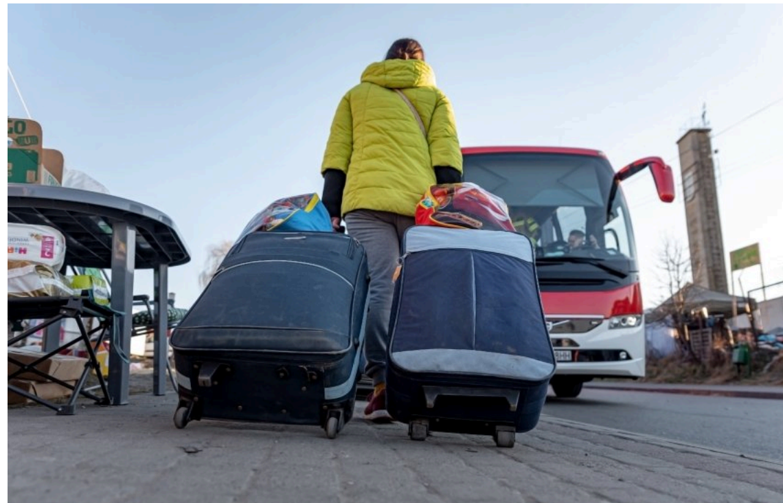
У країнах ЄС зросла кількість українських біженців

Станом на 30 квітня 2026 року кількість громадян України із тимчасовим захистом в ЄС досягла 4,37 мільйона осіб. За один місяць цей показник зріс на 42 990 осіб (+1,0%), при цьому найбільший приріст зафіксовано у Польщі, Італії та Німеччині.