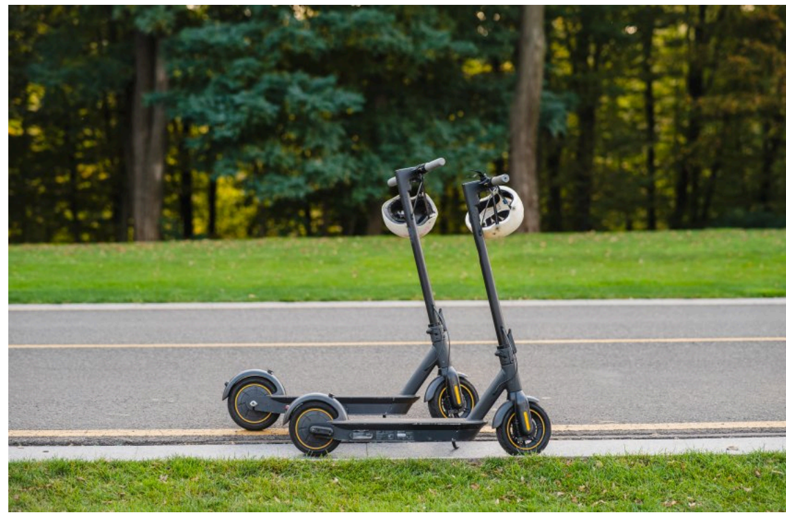
В Україні змінять правила для електросамокатів та моноколес

11 червня Комітет Верховної Ради з питань транспорту та інфраструктури рекомендував парламенту ухвалити законопроект № 3023, який вперше врегулює використання персонального легкого електротранспорту в Україні.