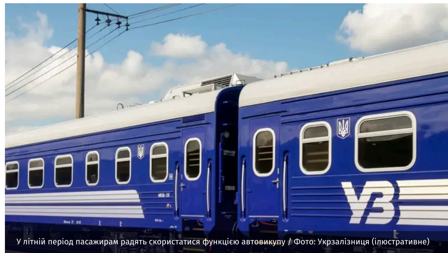
У літній період пасажиром радять скористатися функцією автовикупу

У період літніх відпусток попит на квитки на потяги різко зростає. Щоб спростити процес купівлі й підвищити шанси встигнути на потрібний рейс, можна скористатися функцією автовикупу.