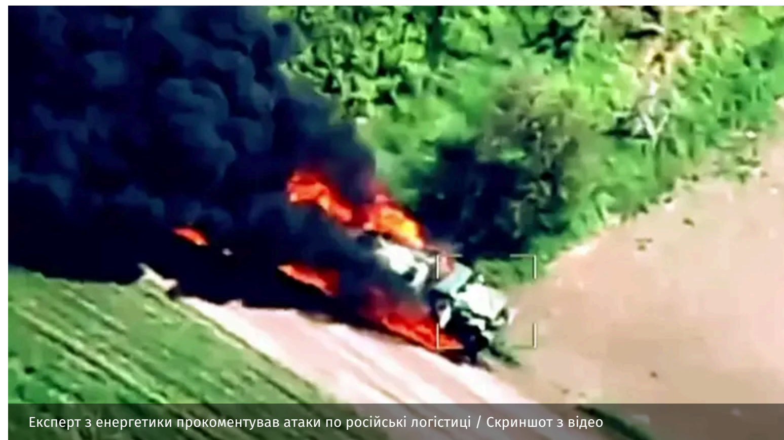
Експерт з енергетики прокоментував атаки по російській логістиці / Скриншот з відео

Існує думка, що удари Сил оборони України по НПЗ та інших нафтогазових об'єктах завдали Росії більше шкоди, ніж європейські та американські санкції. З нею можна погодитися. Та зараз важливо продовжувати ці удари.