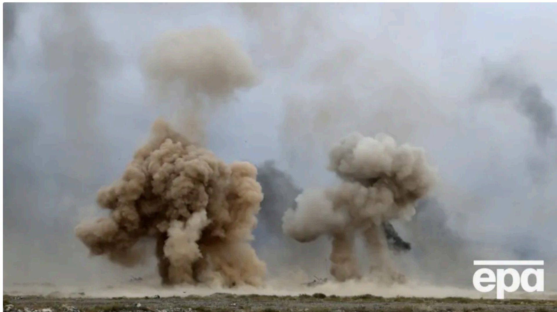
ЗСУ атакували логістику росіян на тимчасово окупованих територіях (ілюстративне)

11 червня, 15.44 🗣️ Этот материал также можно прочитать на русском