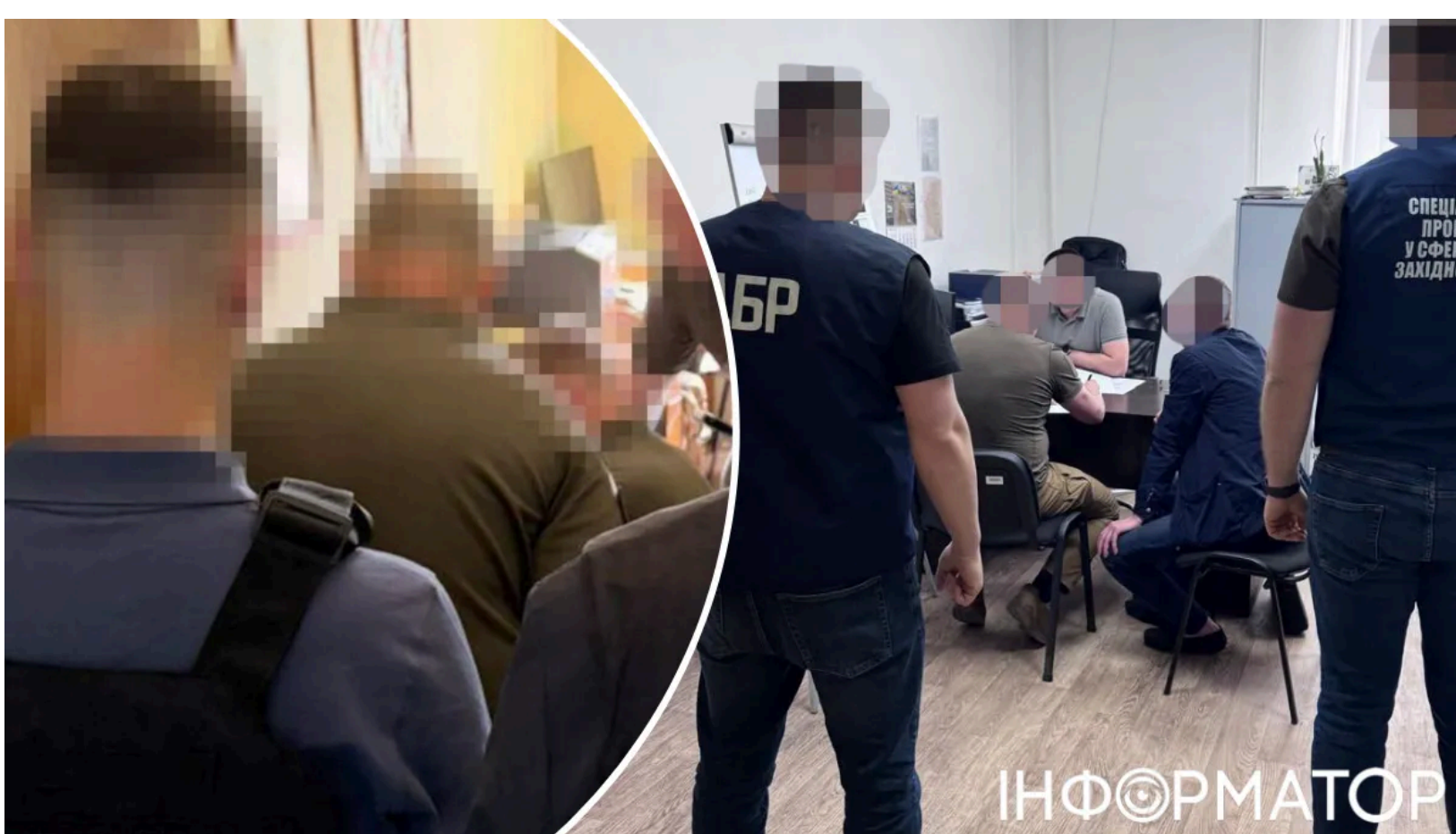
Посадовці вносили недостовірні дані.

Троє начальників районних територіальних центрів комплектування Тернопільської області штучно завищували кількість мобілізованих у звітах - замість реального призову вони повторно реєстрували вже призваних громадян. Схожий масштаб зловживань у системі комплектування виявила Нацполіція, яка у травні 2026 року влаштувала облави на посадовців ТЦК по всій Україні . Наразі справу тернопільських военкомів розслідують СБУ та Державне бюро розслідувань спільно з Нацполіцією. Зловмисникам загрожує до шести років позбавлення волі.