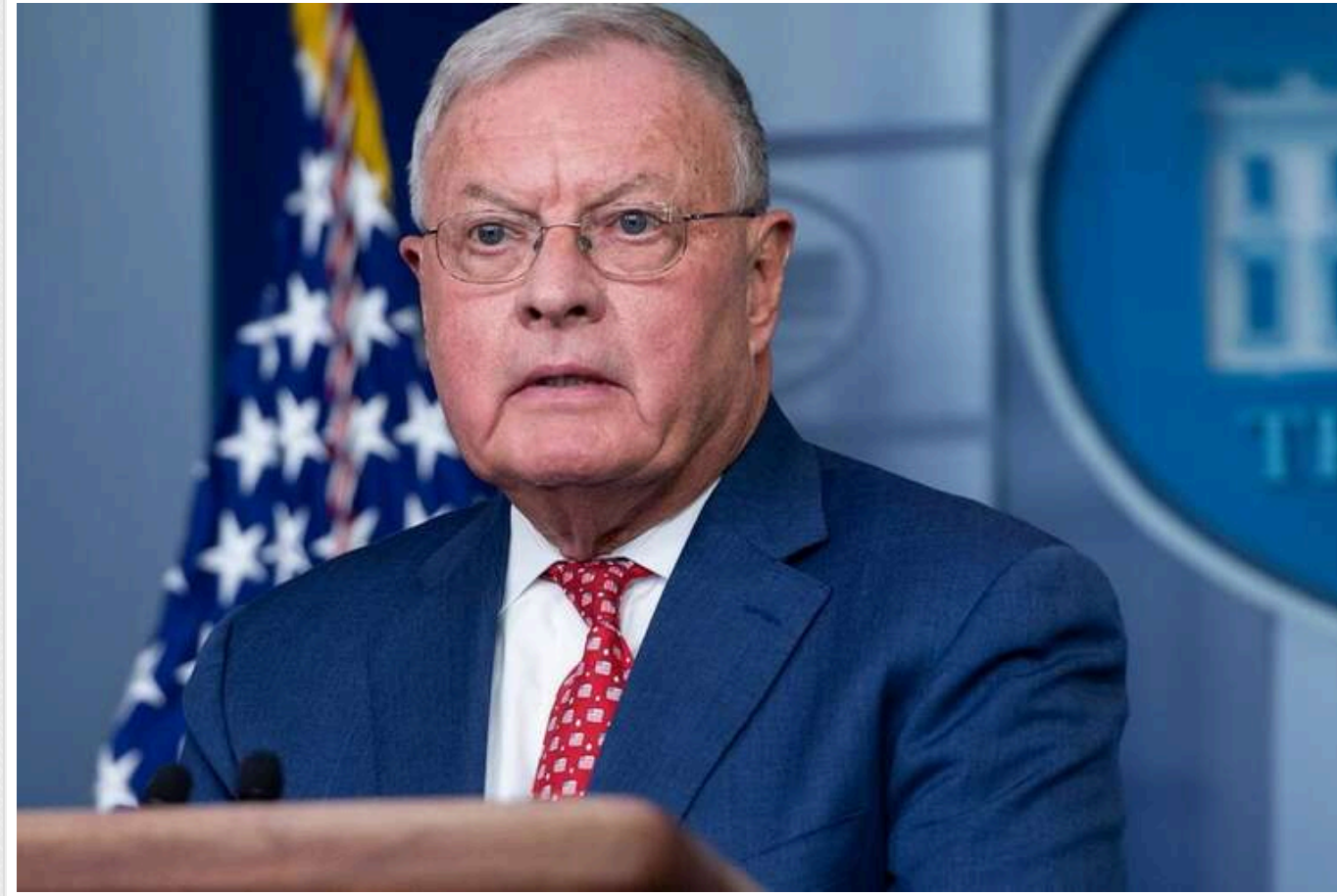
30-денне перемир'я стане початком кінця війни РФ проти України, - Келлог

Читати на руськом Додати як бажане джерело в Google