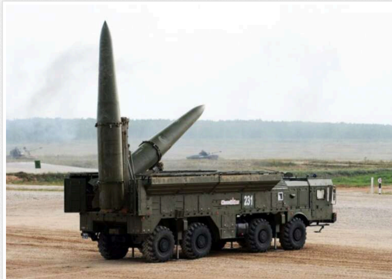
The Economist: Росія щорічно виробляє понад 1,4 тисячі ракет «Іскандер» та 500 Х-101

Росія продукує понад 1400 балістичних ракет «Іскандер» та 500 крилатих ракет Х-101 щорічно.