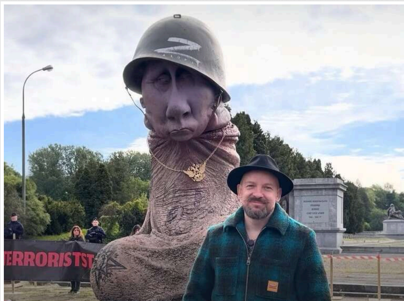
У Варшаві з'явився «пам'ятник режиму»: перед радянським монументом встановили скульптуру у вигляді фалоса з обличчям Путіна

Читати на руськом Додати як бажане джерело в Google