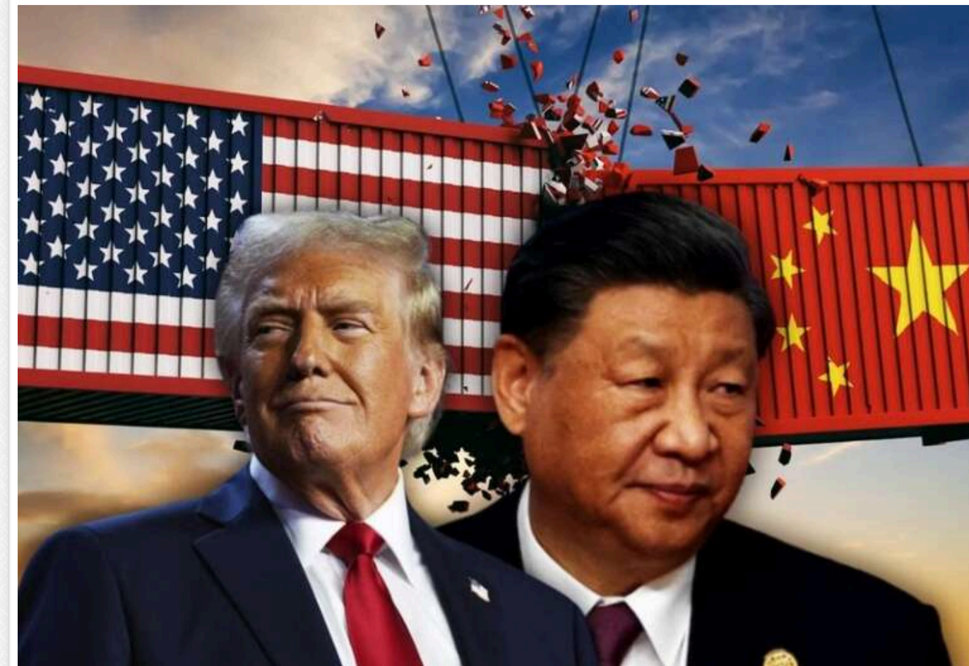
Трамп анонсує можливе зниження мит на китайські товари з 145% до 50% перед переговорами в Швейцарії

Трамп може зменшити мита на китайські товари зі 145% до 50% вже наступного тижня, повідомляє New York Post , посилаючись на джерела.