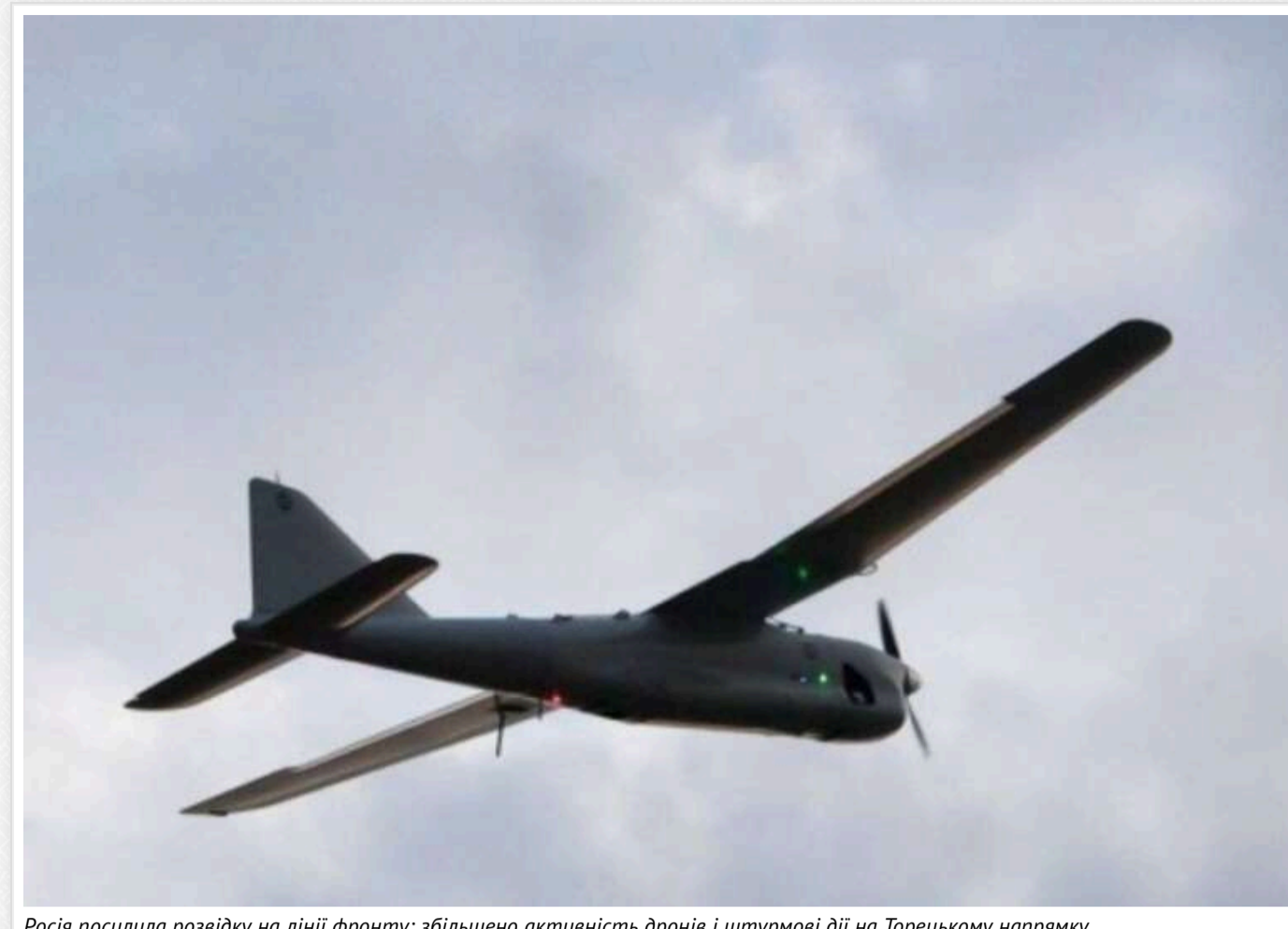
Росія посилила розвідку на лінії фронту: збільшено активність дронів і штурмові дії на Торецькому напрямку

У межах відповідальності оперативно-тактичної групи "Луганськ" російські війська сьогодні підвищили активність розвідки на лінії зіткнення.