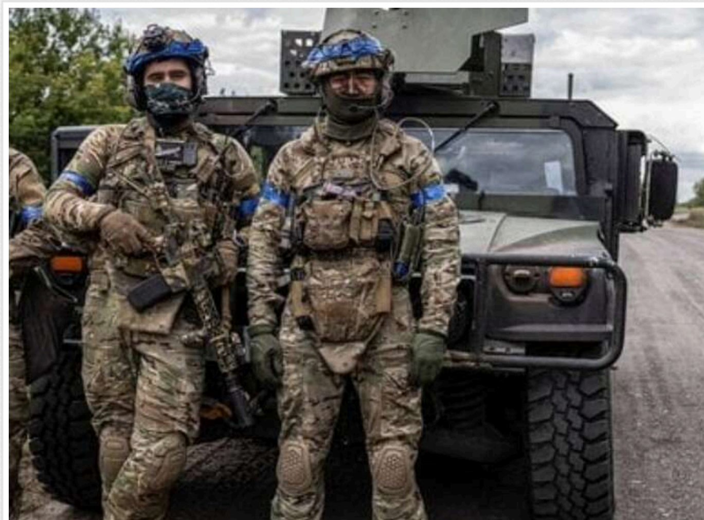
В ISW підтвердили просування ЗСУ на Курщині

Країна-агресорка Росія, чії війська 8 травня обстріляли авіабомбами Сумщину, намагалася звинуватити Україну в порушенні путінського "перемир'я", зокрема на Курщині. Хоча Сили оборони України просунулися в цьому регіоні до моменту одностороннього запровадження ворогом припинення вогню на "день перемоги".