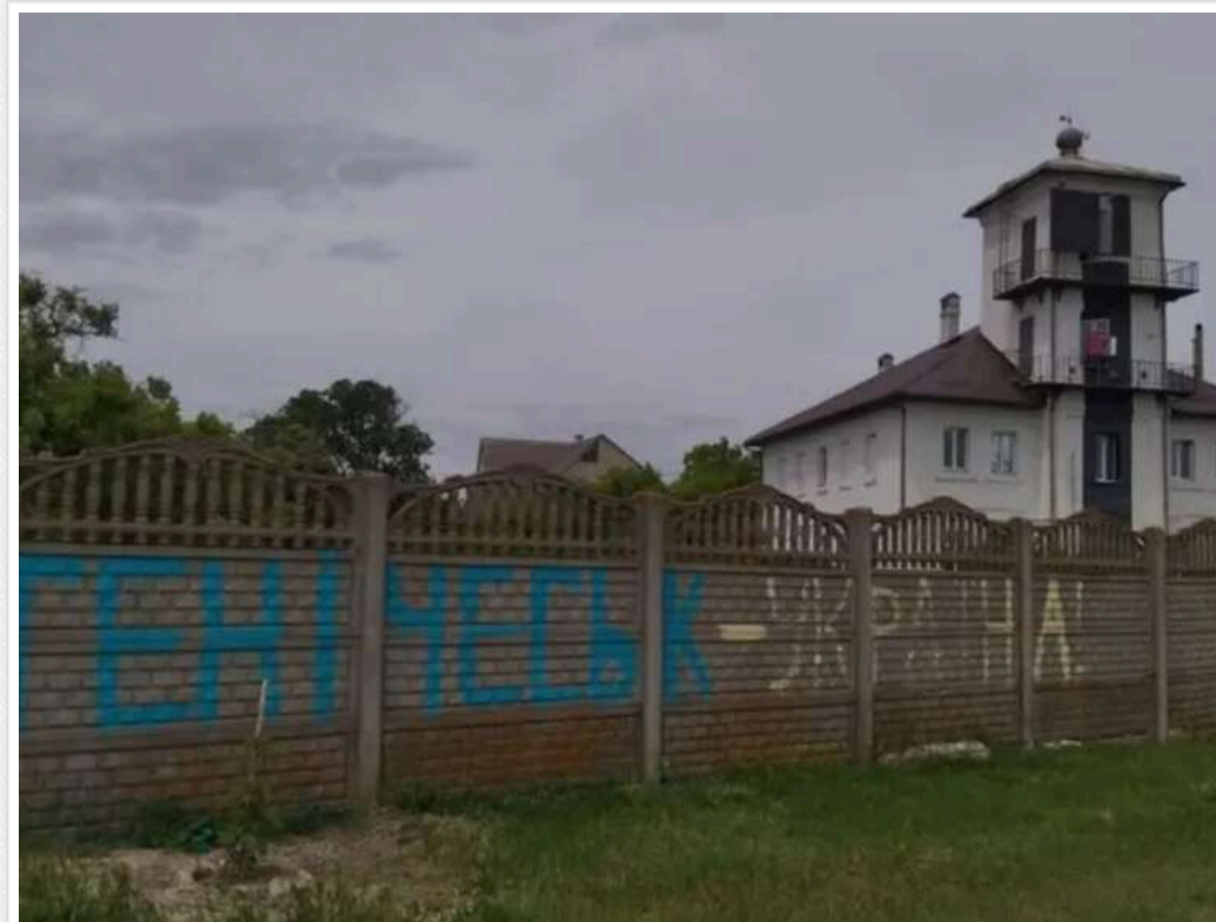
Росія виселяє мешканців окупованих територій і позбавляє їх осель, - ISW

Країна-агресорка Росія проводить інвентаризацію нерухомості на тимчасово окупованих територіях України з метою вилучення майна в українських жителів. Вона робить це частково й для того, щоб посприяти переселенню громадян РФ у захоплені українські міста й села.