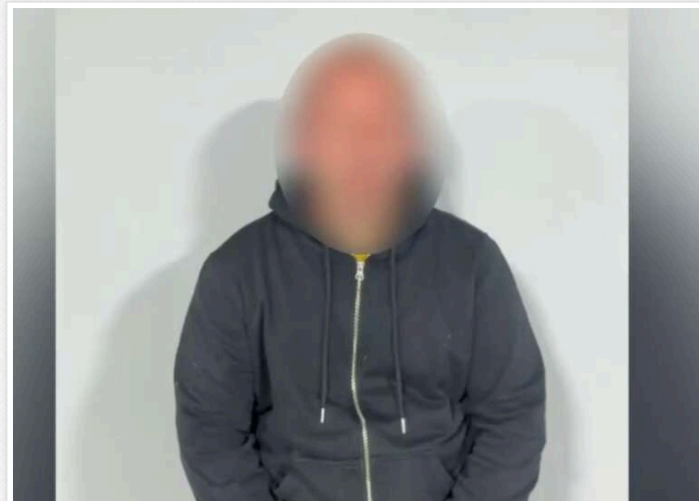
СБУ на Закарпатті вперше викрила агентурну мережу військової розвідки Угорщини

Служба безпеки України вперше в історії країни викрила агентурну мережу військової розвідки Угорщини, яка здійснювала шпигунську діяльність проти України.